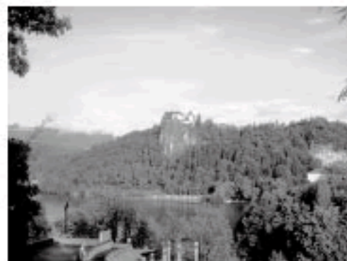
会場付近から湖岸の古城を望む

スロベニア共和国は旧ユーゴスラビアの一部でイタリアの東隣に位置する人口 200 万人ほどの国です。ブレッド市は、ブレッド湖とそこに浮かぶ小島に建つ教会そして湖畔の絶壁にある城が有名な観光地です。温暖な気候に恵まれた風光明媚なところで、旧ユーゴスラビアの大統領チトーが別荘を設けたほどです。シルバーウィークに近いこともあり随分と多くの日本人観光客の姿を見かけました。日本からブレッド市へのアクセスは、ヨーロッパ各地を経由し空路にて首都リュブリャナに入ります。そこから電車やタクシーなどを利用し 1 時間ほどの距離です。時間に余裕があればウィーンなどから電車を利用するのも面白いかと思います。