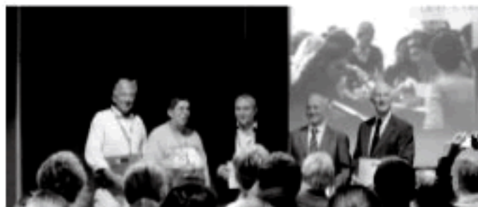
ESVDの設立メンバー【一番右端がLloyd先生】

午後はLloyd先生の膿皮症、抗生物質療法、細菌の過剰増殖(overgrowth)に関する講演です。膿皮症の診断において、病変により症状を見分けること、厳密な診断的なアプローチをすること、潜在疾患の特定と治療が重要である、と話されました。さらに、膿皮症の治療において、ステロイドは病変の状態を隠してしまうため決して使用しないこと、多剤耐性菌の疑いがある場合は培養検査を行うこと、治療がうまくいかない場合は薬用量・使用薬・診断そのものの見直しや潜在疾患を洗いなおすこと、を話されました。さらに、コンベニアは長期間効く使い勝手のよい抗生物質であるが、使用する場合は能書に記載されている通り「本剤は、第一次選択薬が無効の症例に限定し使用すること(restrict to cases where other registered antimicrobials cannot used)」が条件となることを強調されていました。細菌の過剰増殖については、それによって“痒み”が引き起こされること、診断的アプローチが重要であること、初期では細菌の引き起こす痒みを除外すること、その診断にはスコッチテープ法が有用であること、多剤耐性菌がある場合はそれに対する試験を行うことなどを述べられました。