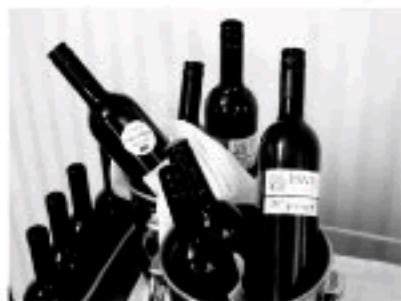
学会特製のワイン

大会 2 日目終了後には“ディナーダンス”が湖畔のホテルで開催されました。オープニングでは、スロベニア共和国の有名な歌が湖上のボートから披露され、学会用に作られた美味しいワインを味わい、ライトアップされた城や教会を眺めながらの夜会は大変楽しいものでした。高名な先生が音楽にあわせて楽しそうに踊るという、欧米流の楽しみ方を見ることができました。